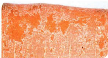
Пример посеребрения и отмирания кожицы после разрыва и обезвоживания клеток кожицы корнеплода (после мойки).